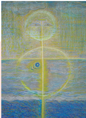
Dorothea Stockmar – Bilder und Klänge