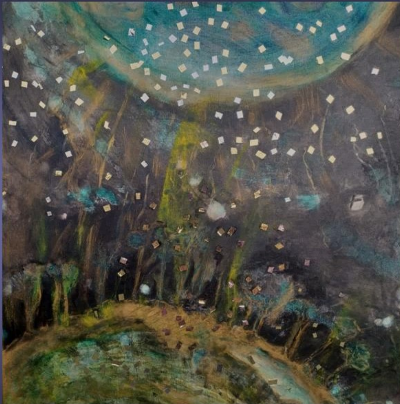
Dorothea Stockmar - Coincidece, 2023, Mixed Media, 80x80cm