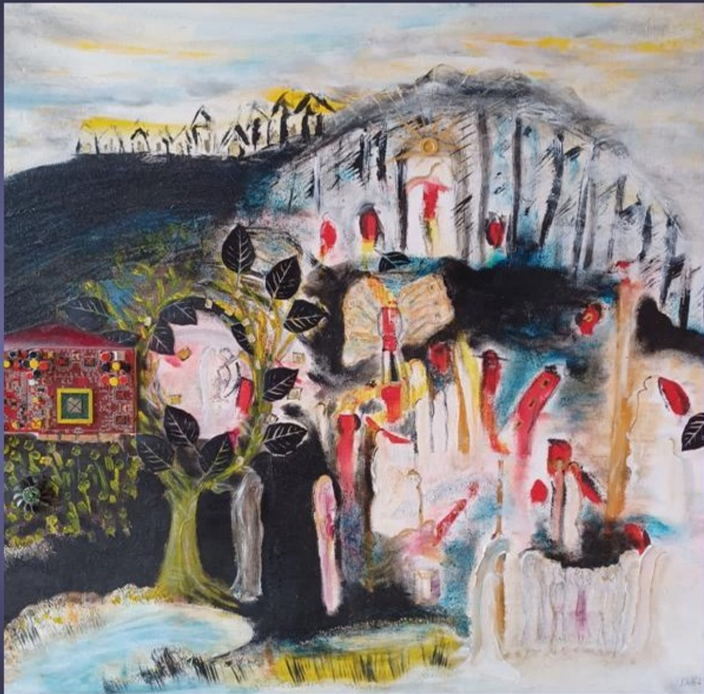
Dorothea Stockmar - Durchbruch II, 2023, Mixed Media, 90x90cm