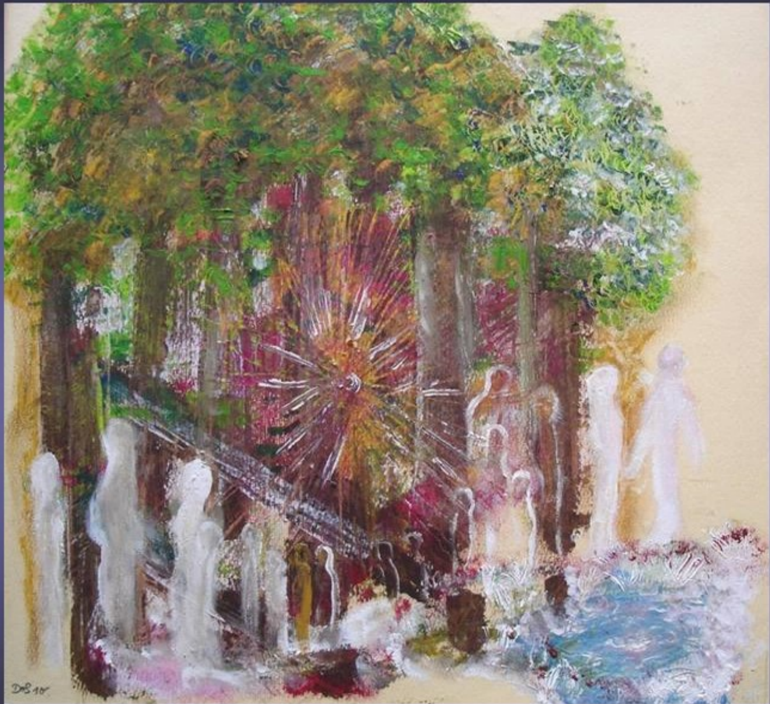
Dorothea Stockmar - Nach dem Einschlag, 2010, Ölfarbe, 34x34cm