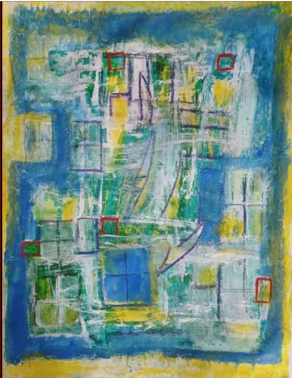
Dorothea Stockmar - Ein und Aussichten, 62x52cm, Mischtechnik, 2021