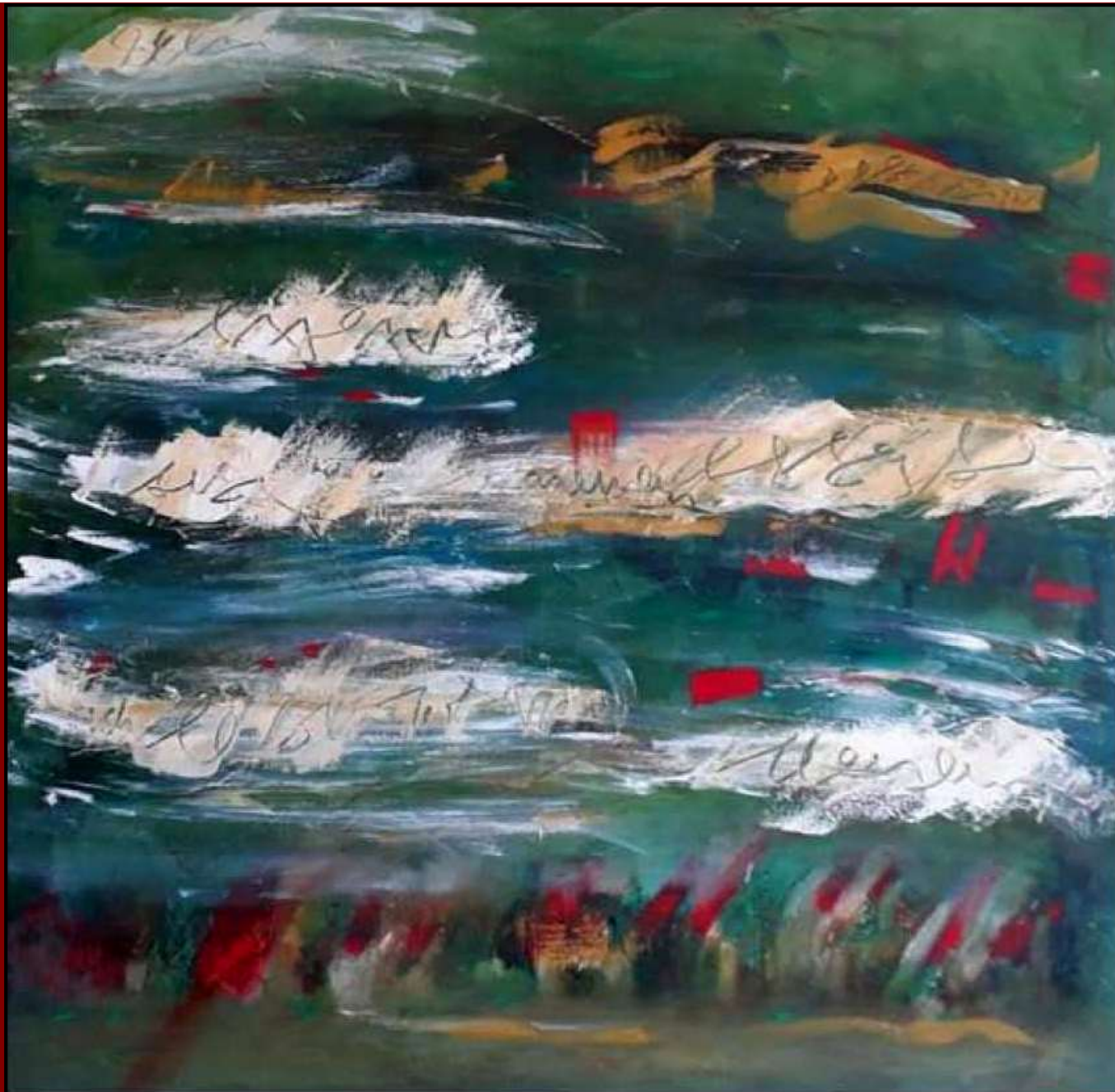
Dorothea Stockmar - Fortschreibung der Zukunft II, 90x90cm, Mischtechnik, 2020