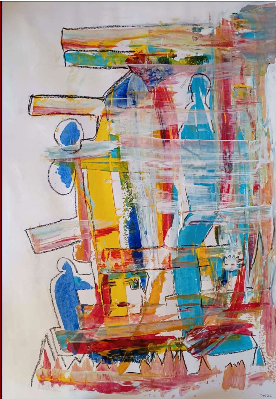
Dorothea Stockmar - Zwischen Bangen und Hoffen, 70x60cm, Mischtechnik, 2022