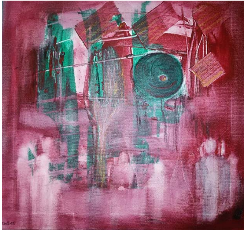
D. Stockmar - leben und lieben, Acryl, 40x40cm, 2015