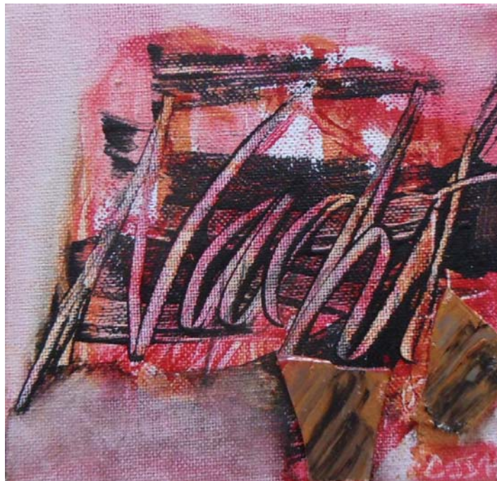
D. Stockmar - nächtlich, Mischtechnik, 20x20cm, 2014