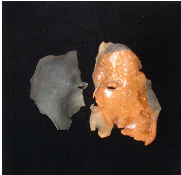
D. Stockmar – ent-zwei, Maske auf Samt, 20x20cm, 2011