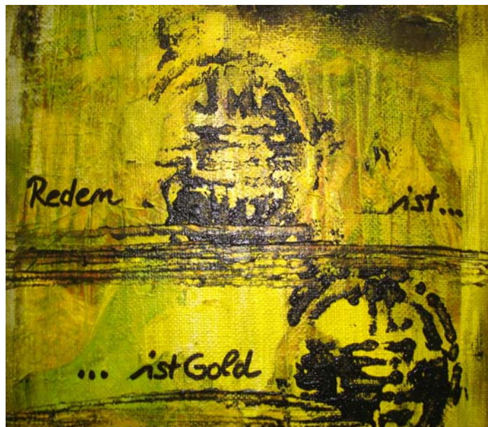
D. Stockmar – Reden ist..ist Gold, Mischtechnik, 20x20cm, 2013