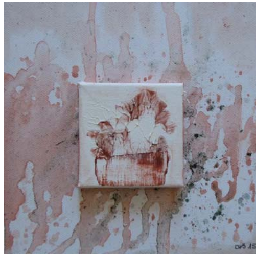
Dorothea Stockmar - Späte Einsicht Nr.2, Acryl, 20x20cm, 2015