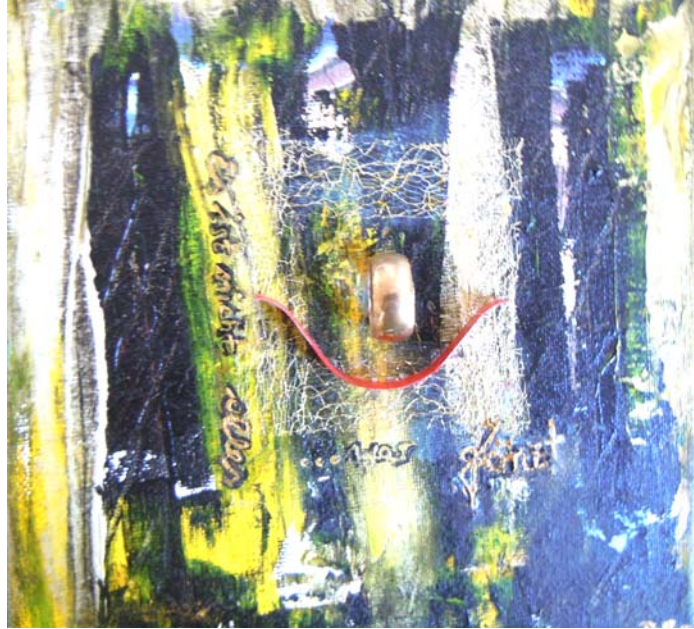
D. Stockmar – es ist nicht alles Gold was glänzt, Mischtechnik, 20x20cm, 2013