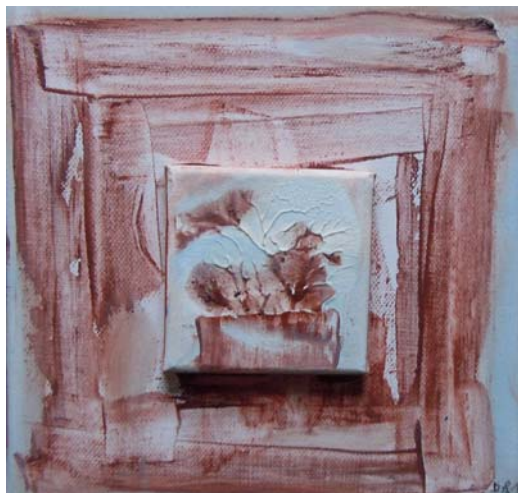
Dorothea Stockmar - Späte Einsicht Nr.3, Acryl, 20x20cm, 2015