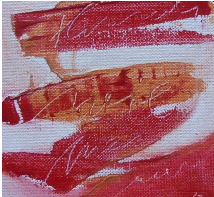
D. Stockmar - Himmel wie neu, Acryl, 30x30cm, 2014