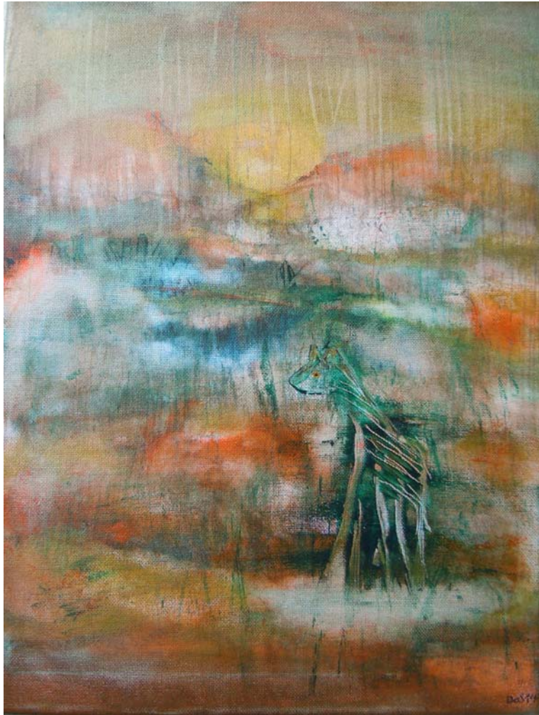
D. Stockmar - Wer sieht mich? Acryl, 40x30cm, 2014