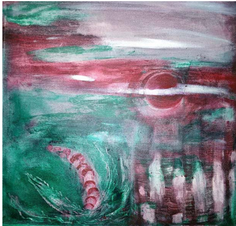
D. Stockmar - Neue Wege, Acryl, 40x40cm, 2015