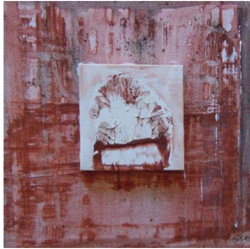
Dorothea Stockmar - Späte Einsicht Nr.1, Acryl, 20x20cm, 2015