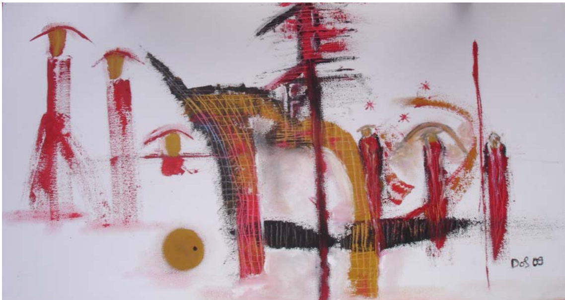
D. Stockmar - Übergang VII, Ölfarbe, 33x60cm, 2009