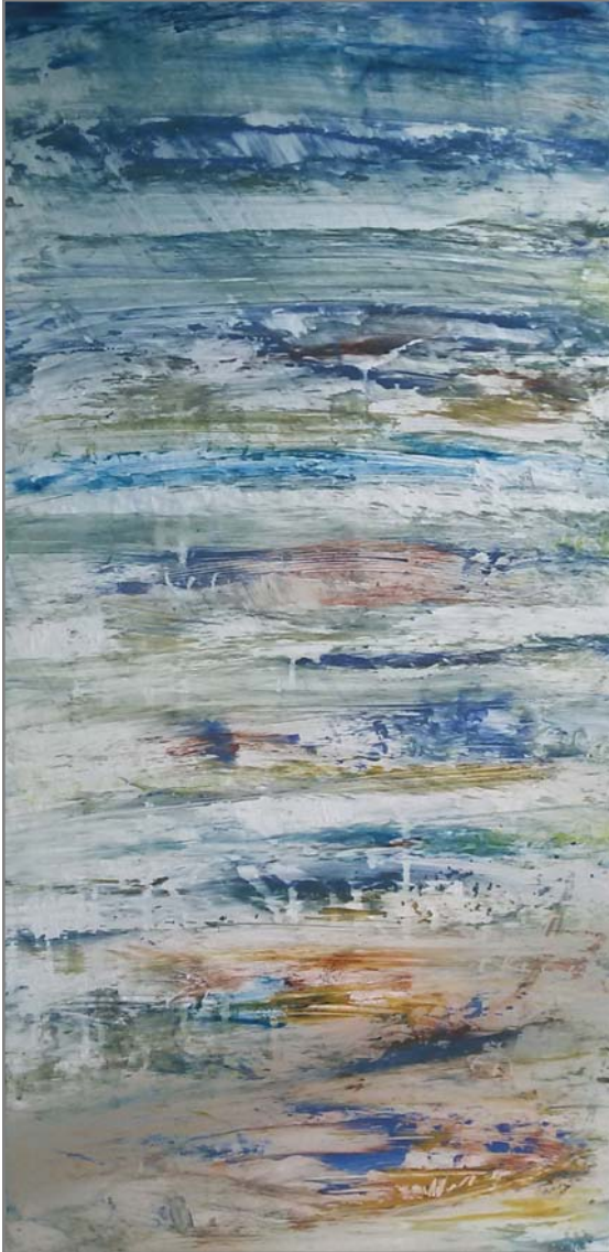
Dorothea Stockmar - Glasklar, Acryl auf Glas, 75x36cm, 2016