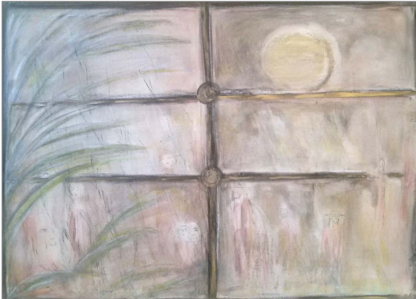
Dorothea Stockmar - Zeugen einer anderen Zeit, Mischtechnik, 50x70cm, 2016