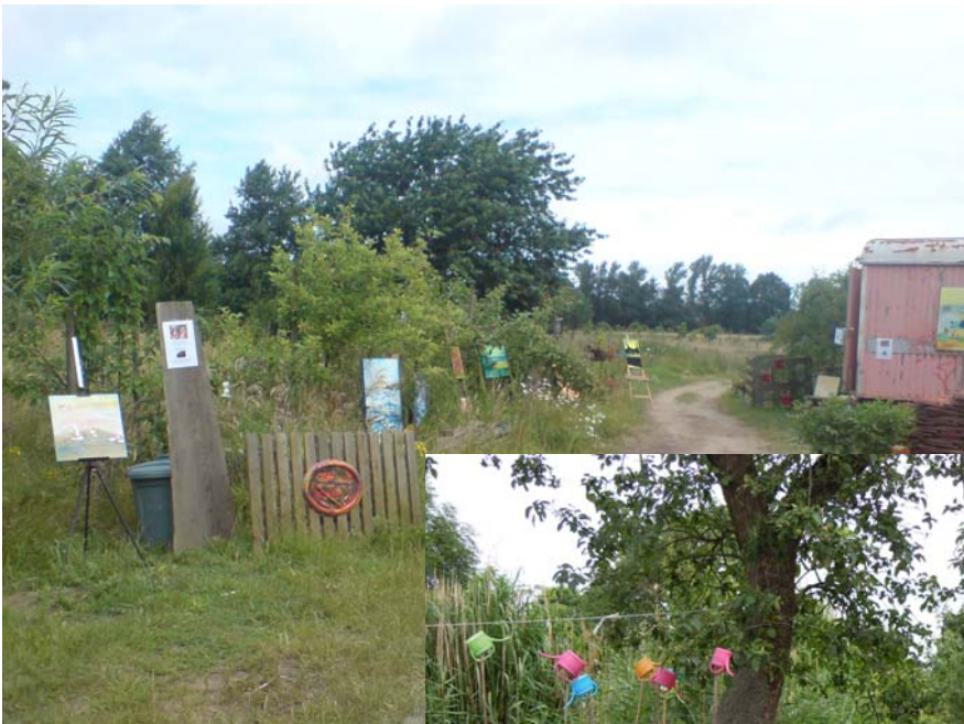
Ort der Lesung