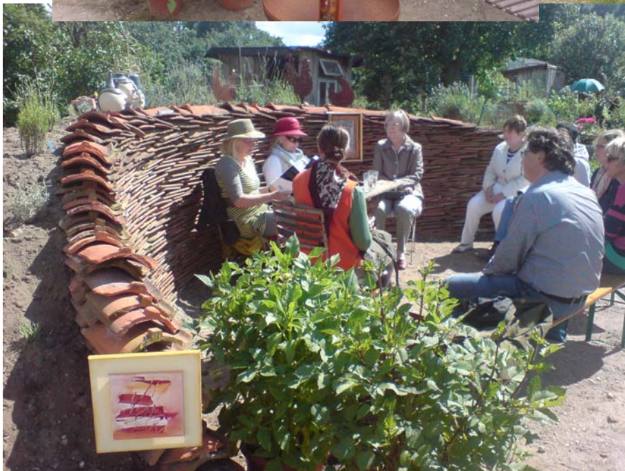
Wenn das Wetter es zuließ, wurde draußen gelesen.