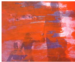
D. Stockmar – im Fluss, Mischtechnik, 17x17cm, 2014