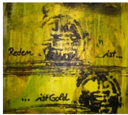
D. Stockmar – Reden ist, Schweigen ist, Mischtechnik, 20x20cm, 2013