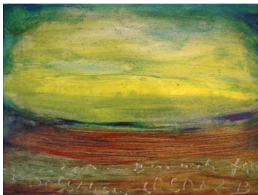
D. Stockmar – unbestimmt, Acryl auf Leinwand, 40x60cm, 2013

Mit meinen Arbeiten möchte ich Menschen hinter ihren Worten erreichen. Neue Sinnzusammenhänge können sich erschließen.