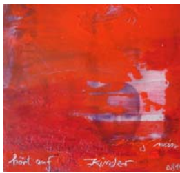
D. Stockmar – hört auf Kinder, Mischtechnik, 17x17cm, 2014