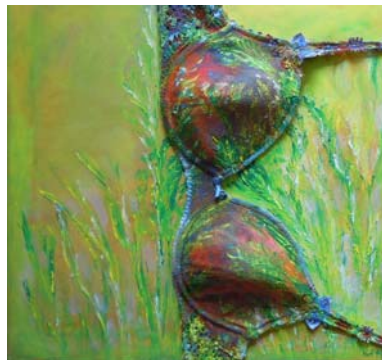
D. Stockmar – aufgetaucht, Installation auf Leinwand, 40x40cm, 2014