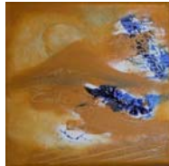
D. Stockmar - am Ende, Acryl auf Leinwand, 20x20cm, 2014