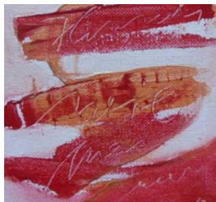
D. Stockmar - Himmel wie neu, Acryl auf Leinwand, 30x30cm, 2014