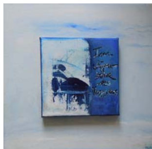
D. Stockmar - im Augenblick des Vergessens, Acryl auf Leinwand, 30x30cm, 2014