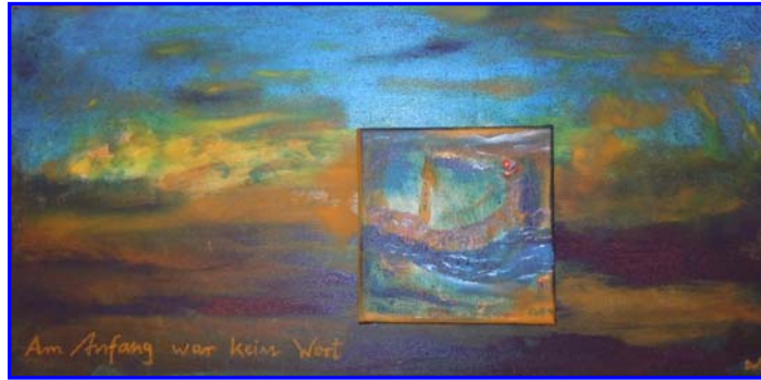
D. Stockmar – Am Anfang war kein Wort, Mischtechnik, 30x60cm, 2014