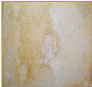
D. Stockmar – Spuren im Sand II, Mischtechnik auf Leinwand, 40x40cm, 2014