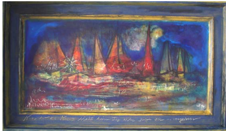
D. Stockmar – Nun ist es Nacht, Mischtechnik, 43x73cm, 2014