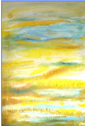
D. Stockmar – aus der Stille 2, Acryl auf Leinwand, 60x40cm, 2014