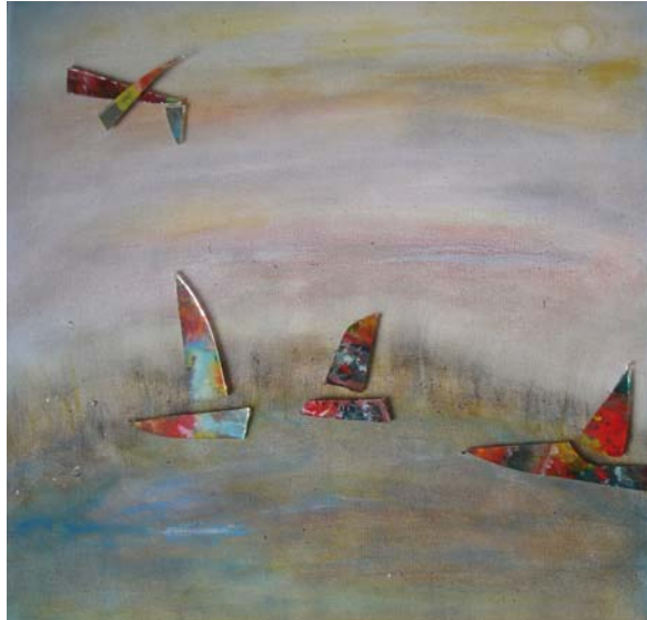
D. Stockmar - all zu leichtes Spiel, Mischtechnik auf Leinwand, 40x40cm, 2014