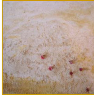
D. Stockmar – Spuren im Sand I, Mischtechnik auf Leinwand, 30x30cm, 2014