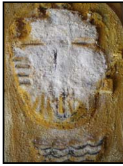
D. Stockmar – Spuren im Sand III, Mischtechnik, 24x17cm, 2014