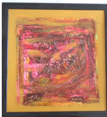
D. Stockmar – ja oder nein, Acryl auf Pappe, 46x50cm gerahmt, 2014