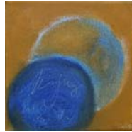
D. Stockmar - Anfang und Ende, Acryl auf Leinwand, 20x20cm, 2014