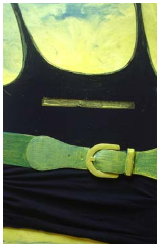
D. Stockmar – gegürtet, Installation auf Leinwand, 60x40cm, 2014