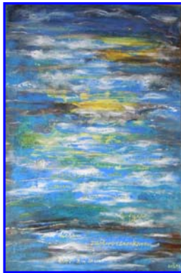
D. Stockmar – Zeitversunken, Acryl auf Leinwand, 60x40cm, 2014