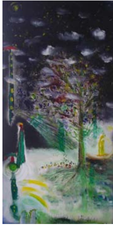
D. Stockmar - Öffnung I, 60x30cm, Ölfarbe auf Leinwand, 2010