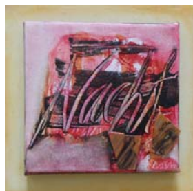
D. Stockmar - nächtlich, Mischtechnik auf Leinwand, 20x20cm, 2014