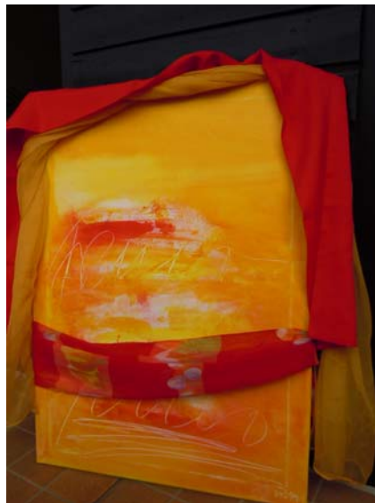
D. Stockmar - Kunstfeuer, Installation, 70x50cm, 2014