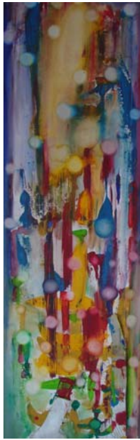
D. Stockmar - Lebensfreude, Mischtechnik, 100x30cm, 2014