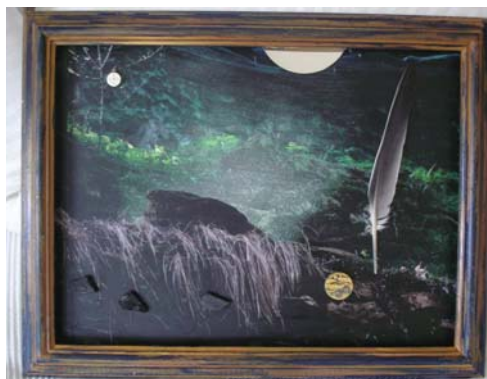
D. Stockmar – nachthelle Kammer, Installation, 35x45cm, 2014