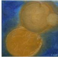
D. Stockmar - Ende und Anfang, Acryl auf Leinwand, 20x20cm, 2014