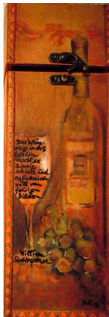
D. Stockmar – weinselig, Kiste bemalt, 40x11cm, 2013