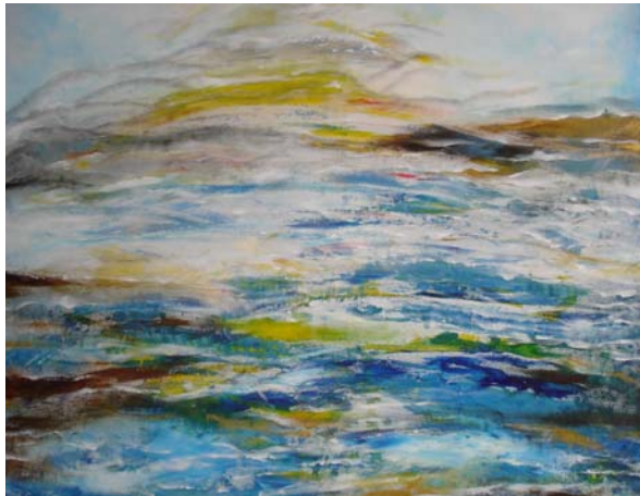
D. Stockmar – Meerblick, Acryl auf Leinwand, 90x90cm, 2012