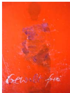
D. Stockmar – Gewalt frei, Mischtechnik, 17x17cm, 2014