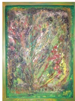
D. Stockmar - Carpe Diem, Acryl auf Hartpappe, 40x30cm, 2014