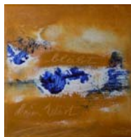
D. Stockmar - kein Wort, Acryl auf Leinwand, 20x20cm, 2014