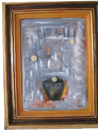
D. Stockmar – befreit von Zeit und Raum, Installation, gerahmt, 45x36cm, 2013