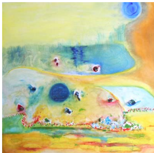
D. Stockmar - im anfänglichen verläuft keine Spur, Mischtechnik, 90x90cm, 2014