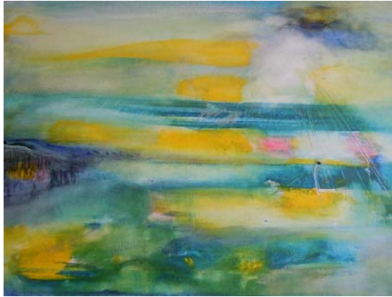
D. Stockmar - große Weite innen, Acryl auf Leinwand, 30x60cm, 2014