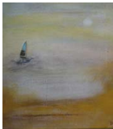
D. Stockmar - letzte Fahrt II, Mischtechnik auf Leinwand, 20x20cm, 2014