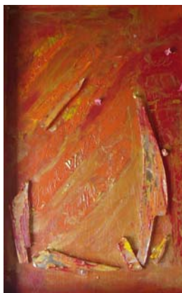
D. Stockmar - all zu dick aufgetragen, Mischtechnik, 50x30cm, 2014