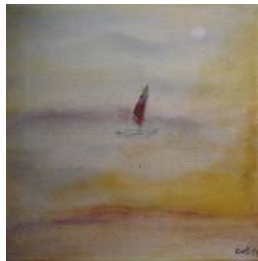
D. Stockmar - letzte Fahrt I, Mischtechnik auf Leinwand, 20x20cm, 2014