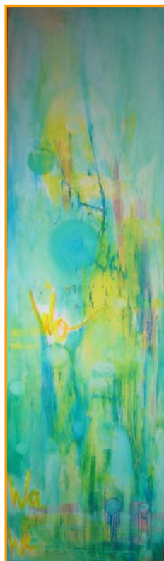
D. Stockmar – Wo We, Acryl auf Leinwand, 100x30cm, 2014