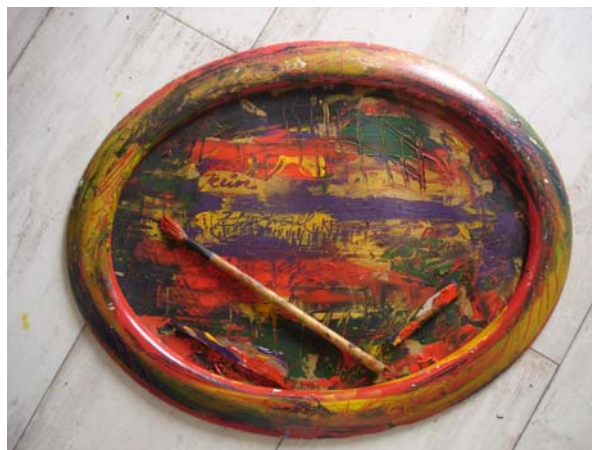
D. Stockmar - kein Zufall, Mischtechnik, 40x 50cm, oval, 2014