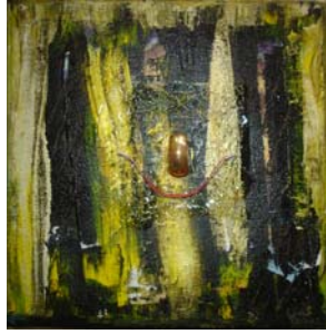
D. Stockmar – Es ist nicht alles Gold, Mischtechnik auf Leinwand, 20x20cm, 2013