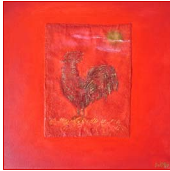
D. Stockmar – roter Hahn, Mischtechnik auf Leinwand, 30x30cm, 2014