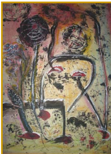
D. Stockmar - gegenüber, Acryl auf Holz, 40x30cm, 2012