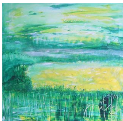
D. Stockmar - grün bleibt grün, Acryl auf Leinwand, 50x50cm, 2014