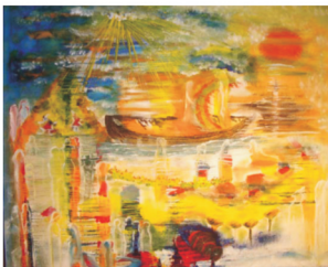
die letzte Reise, Ölfarbe auf Leinwand, 60 x 60 cm, 2010