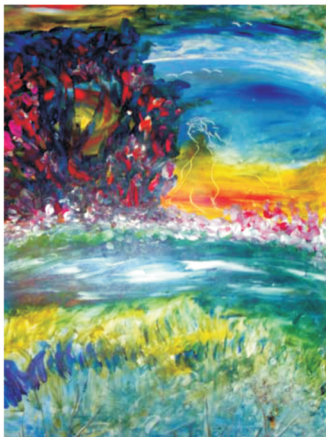
Zwischen Traum und Wirklichkeit, 50 x 40 cm, 2012