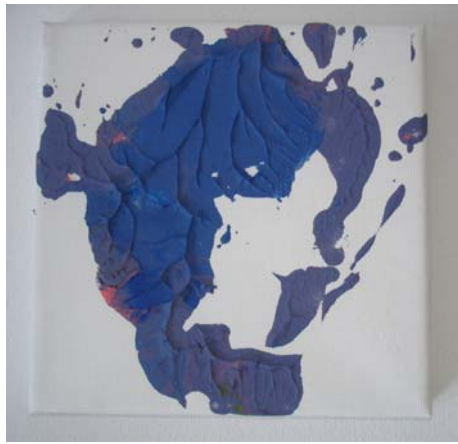
D. Stockmar, „blaue Impression Nr.1“, Leinwand, 20x20cm, 2012