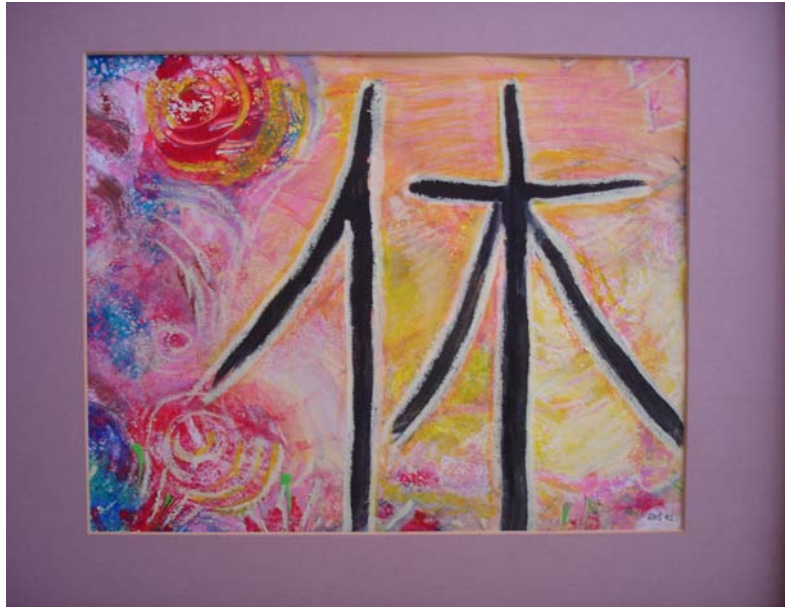
休 / きゅう japanische Zeichen für Ausruhen, Nichtanwesenheit, Muße

D. Stockmar, „Muße“, Mischtechnik, 40x60cm, 2012