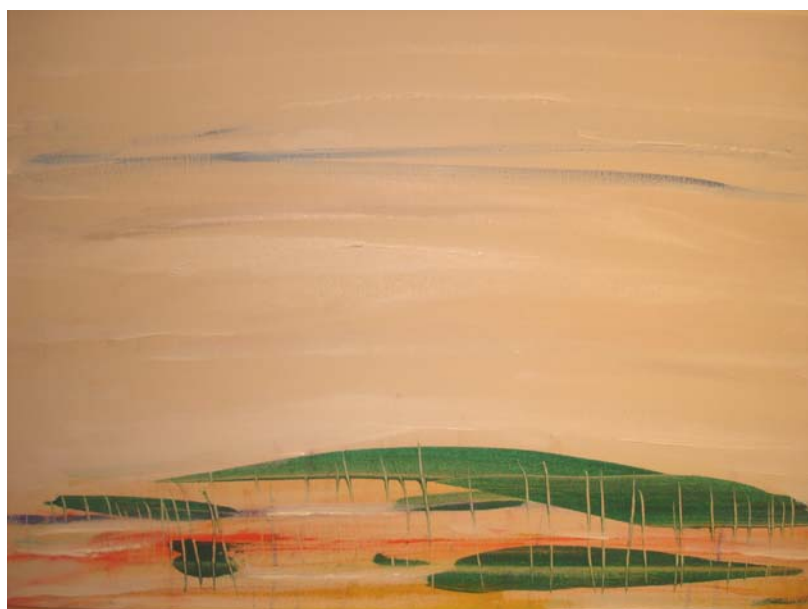
D. Stockmar, „aus der Stille 5“, Acryl auf Leinwand, 30x60cm, 2013