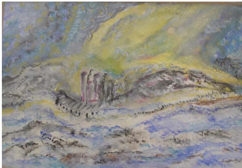
D. Stockmar, „Nordlicht Nr.2“, Aquarell, 20x26cm, 2012