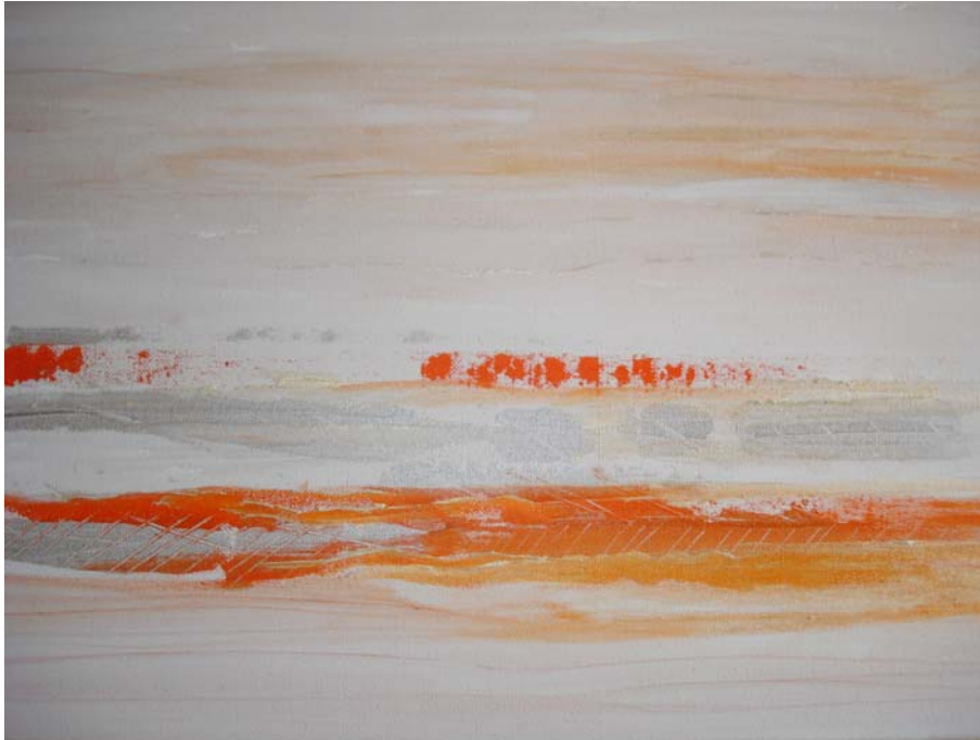
D. Stockmar, „aus der Stille 6“, Acryl auf Leinwand, 40x60cm, 2013