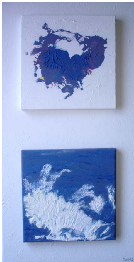
D. Stockmar, „blaue Impression Nr.3“, Leinwand, 60x30cm, 2012