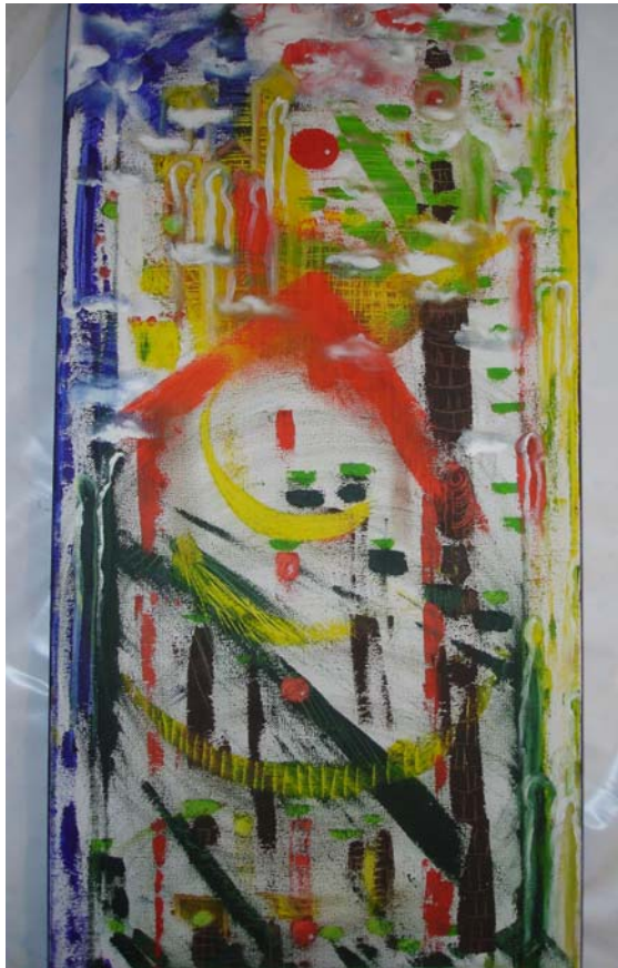
D. Stockmar, „Öffnung 2“, Ölfarbe auf Leinwand, 60x 30cm, 2010