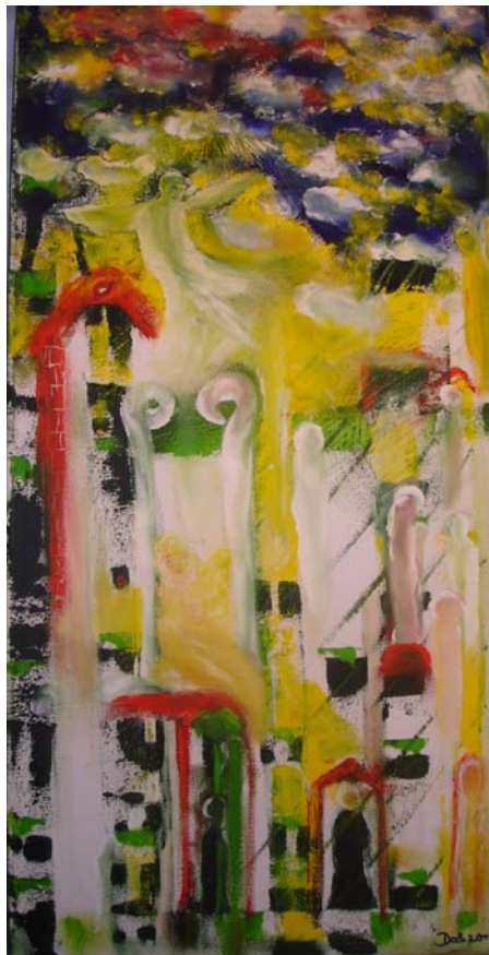
D. Stockmar, „Öffnung 1“, Ölfarbe auf Leinwand, 60x 30cm, 2010