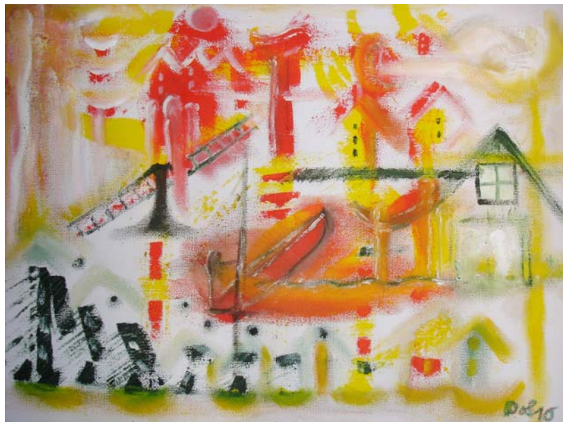
D. Stockmar, „Sonnenboot“, Öl auf Leinwand, 30x40 cm, 2010