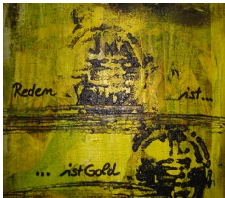
D. Stockmar, „Reden ist ..., ...ist Gold“, Mischtechnik auf Leinwand, 20x20cm, 2013