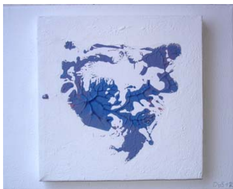
D. Stockmar; „blaue Impression Nr.2“, Leinwand, 24x30cm, 2012