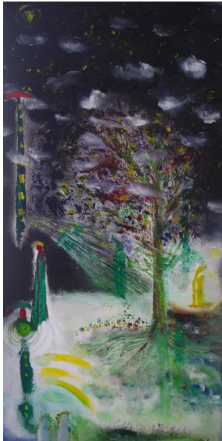
D. Stockmar, „zur Nacht“, Ölfarbe auf Leinwand, 60x30 cm, 2010