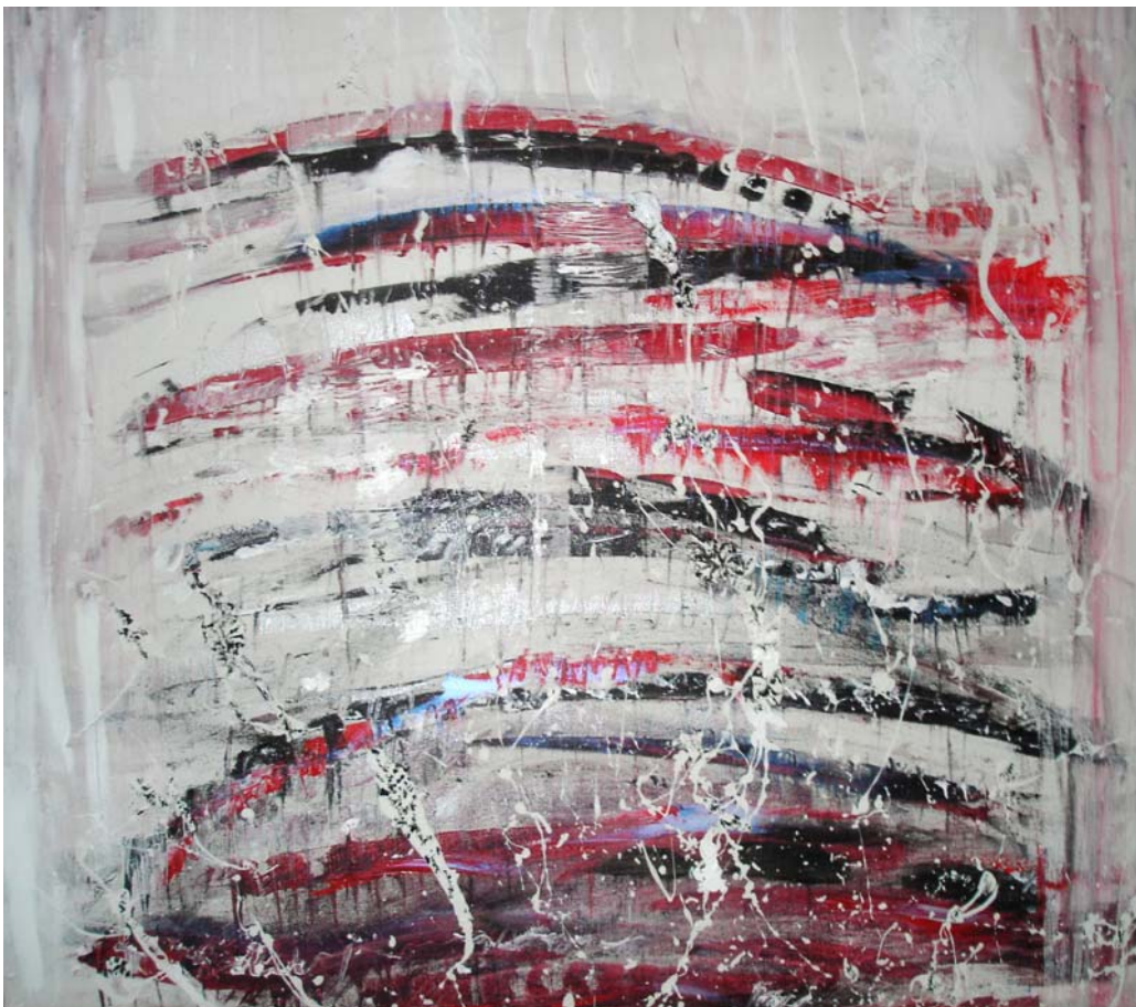
D. Stockmar, „lebendig im Werden“, Mischtechnik auf Leinwand, 90x90cm, 2012

D. Stockmar, „Muße“, Mischtechnik, 40x60cm, 2012