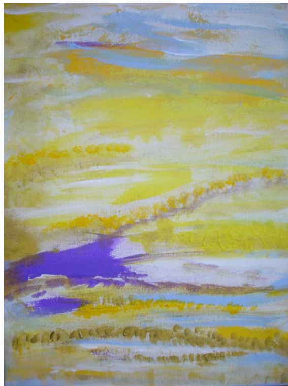
D. Stockmar, „aus der Stille 2“, Acryl auf Leinwand, 60x40cm, 2013